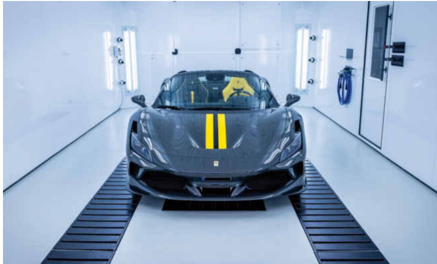
Eine Hightech-Kombikabine und zwei Multifunktionsplätze bilden das Kernstück der von ROWIT gelieferten Lackieranlage.

den Konditionen abliefern, die wir für richtig halten. Das passt mit dem, was in der Schadensteuerung in der Regel läuft, nicht zusammen.“ Zu eisi kommt viel private Stammkundschaft, Autohäuser, natürlich auch Versicherungen. Was sie eint: Hoher Anspruch an Qualität, persönliche Ansprache und exzellenten Service.