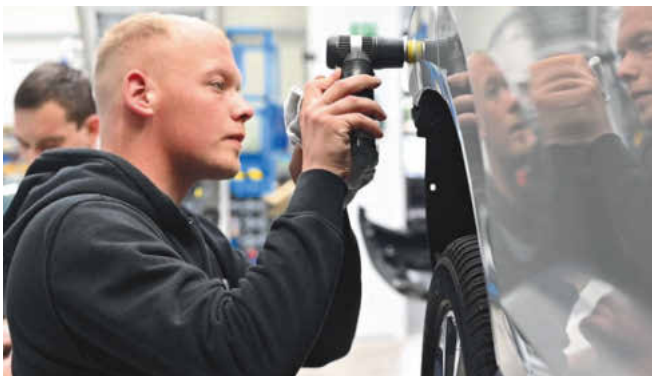
Kernkompetenz: makellose Oberflächen. Auf das Finish wird bei eisi allergrößter Wert gelegt.