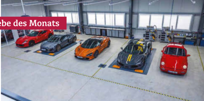
Ordnung muss sein: So sieht es bei eisi nicht nur beim Fototermin aus.