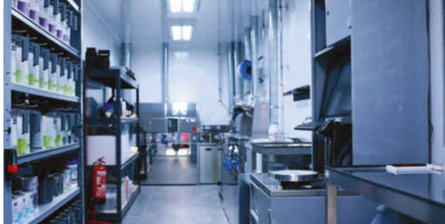
Ein Mischraum wie aus dem Bilderbuch. Die Ausstattung von B-TEC glänzt wie neu. Und das wird auch so bleiben.