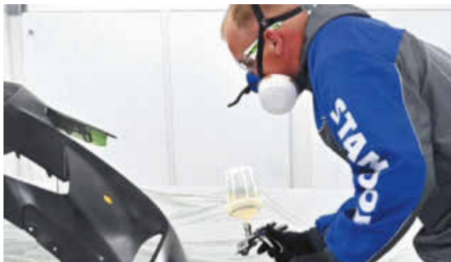
Gewachsene Partnerschaft: Beim Lack setzt die eisi GmbH bereits seit vielen Jahren auf Standox.